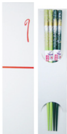
TS-04 マイ箸・塗箸用箱 のし 台紙付 (1膳・2膳兼用) サイズ: 238×55×13mm 上代: ¥100 (箱のみ)