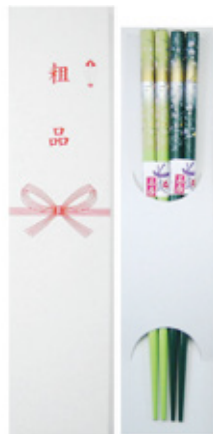
TS-03 マイ箸・塗箸用箱 粗品 台紙付 (1膳・2膳兼用) サイズ: 238×55×13mm 上代: ¥100 (箱のみ)