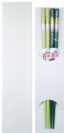
TS-18 マイ箸・塗箸用箱 無地 台紙付 (1膳・2膳兼用) サイズ: 238×55×13mm 上代: ¥100 (箱のみ)