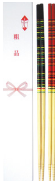
TS-01 菜箸 2膳用箱 粗品 サイズ: 363×55×13mm 上代: ¥100 (箱のみ)