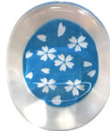
CH9 クリア箸置き 銀舞桜 青 上代：¥400 (バラ) ¥450 (台紙入)