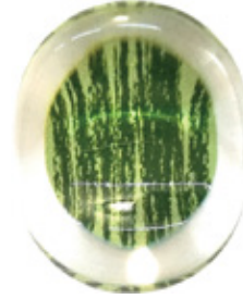
CH12 クリア箸置き 染かすり 緑 上代：¥400 (バラ) ¥450 (台紙入)