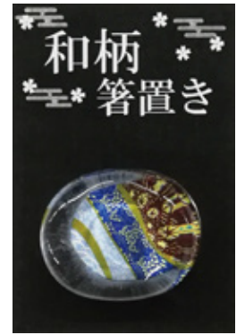
台紙デザイン (OPP 袋入) 台紙サイズ：47mm×70mm