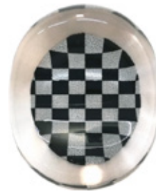
CH4 クリア箸置き 市松 黒 上代：¥400 (バラ) ¥450 (台紙入)