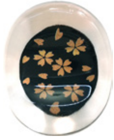
CH6 クリア箸置き 金小花 黒 上代：¥400 (バラ) ¥450 (台紙入)