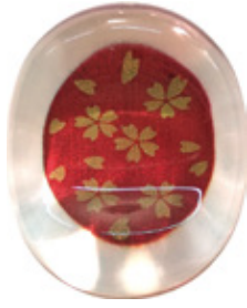
CH7 クリア箸置き 金小花 朱 上代：¥400 (バラ) ¥450 (台紙入)