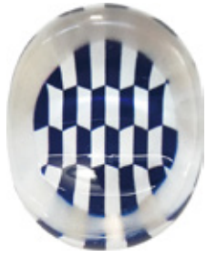
CH1 クリア箸置き 矢羽根 紺 上代：¥400 (バラ) ¥450 (台紙入)