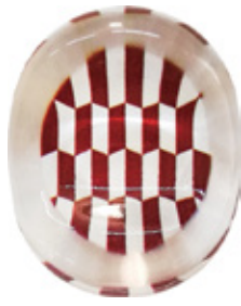
CH2 クリア箸置き 矢羽根 朱 上代：¥400 (バラ) ¥450 (台紙入)