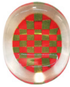
CH3 クリア箸置き 市松 赤 上代：¥400 (バラ) ¥450 (台紙入)