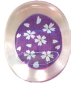
CH10 クリア箸置き 銀舞桜 紫 上代：¥400 (バラ) ¥450 (台紙入)