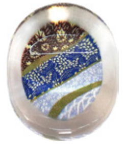
CH5 クリア箸置き 花小紋 上代：¥400 (バラ) ¥450 (台紙入)