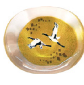
CH14 クリア箸置き 金鶴 上代：¥400 (バラ) ¥450 (台紙入)