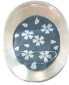
CH8 クリア箸置き 銀舞桜 黒 上代：¥400 (バラ) ¥450 (台紙入)