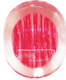
CH13 クリア箸置き 染かすり 赤 上代：¥400 (バラ) ¥450 (台紙入)