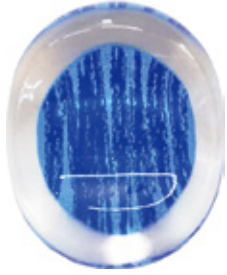
CH11 クリア箸置き 染かすり 青 上代：¥400 (バラ) ¥450 (台紙入)